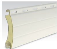
Blind 55 Light