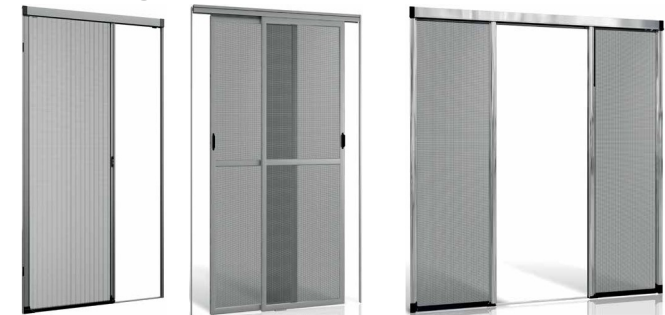
Plissettata - Scorrevole - MOLLA ORIZZONTALE CON BASETTA

In alluminio realizzate su misura complete di rete in fibra di vetro termosaldata sui 4 lati per evitare lo strappo in apertura . Realizzate in varie soluzioni di apertura da quella a catena , plissettata , molla frizionata , portina , telaio fisso magnetico o a saliscendi .